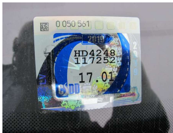
Tehniskā apskate, uzlīme