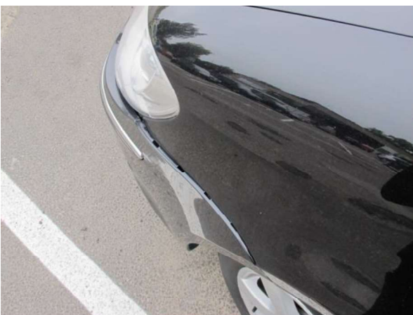
Priekšas kreisās puses spārns