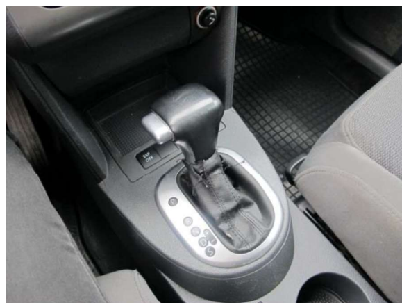
Automātiskā ātrumkārbā 6 pak.