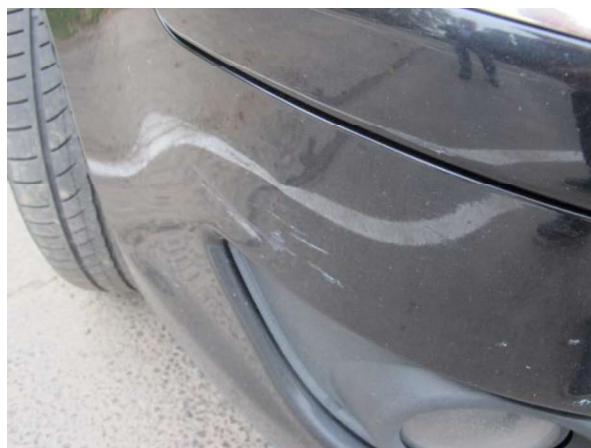
Priekšas bufera uzlika