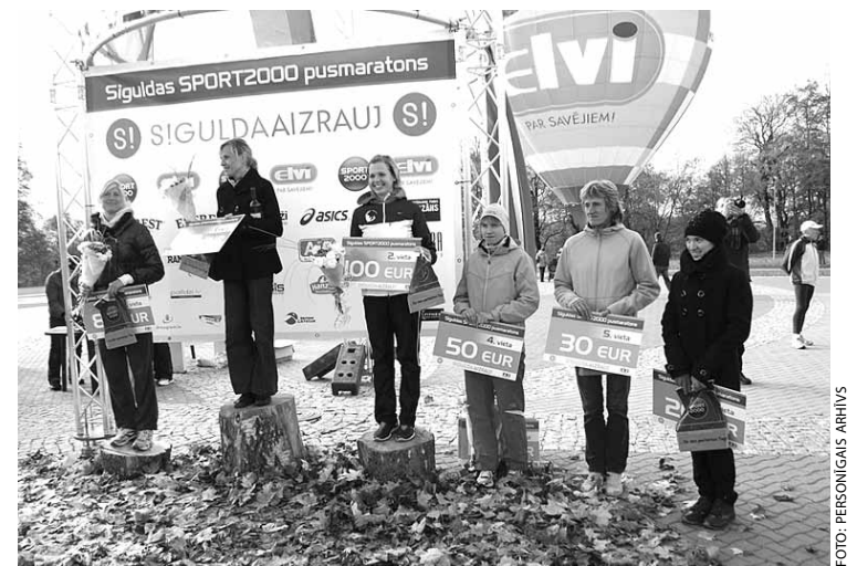
Siguldas "Sport2000" pusmaratona uzvarētājas absolūtajā sieviešu konkurencē.

policijas, gan Siguldas novada Pašvaldības policijas darbinieki. Sacensību norisē tika iesaistīti arī brīvprātīgie jaunieši no Siguldas Sporta skolas. Paldies viņiem par atsaucību.