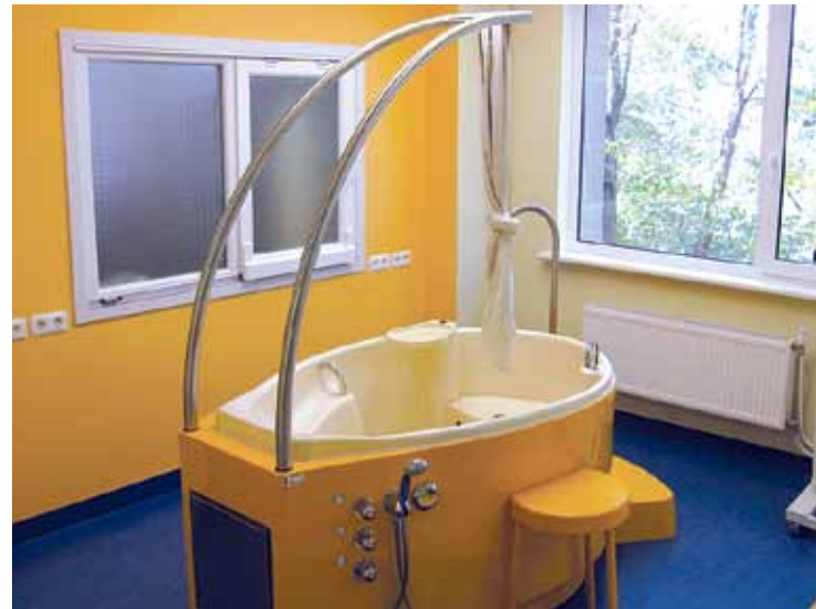
Latvijā pirmā profesionālā sertificētā dzemdību vanna, kas ražota Šveicē.

"Pēdējos gados pasaulē mainās medicīniskā aprīkojuma tendences: iepriekš ļoti svarīgas bija medicīniskā personāla ērtības, bet pēdējos gados aprīkojums arvien vairāk tiek orientēts uz pacientu ērtībām un ergonomiskumu. Līdz ar to arī šī – Latvijā pirmā profesionālā sertificētā dzemdību vanna, kas ražota Šveicē, – veidota, ņemot vērā akušieru pieredzi par drošību dzemdību procesā un praksē pārbaudītām dzemdību atvieglošanas