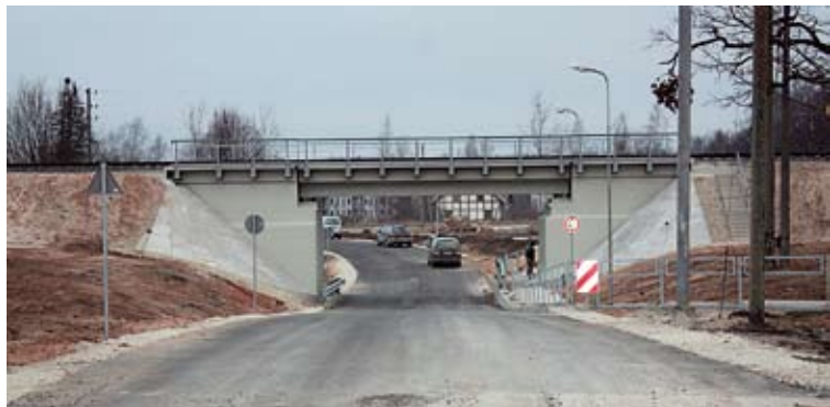
Nītaures ielas caurbrauktuves atklāšana bija viens no vērienīgākajiem infrastruktūras sakārtošanas projektiem.

Budžeta samazinājums nozīmē, ka nākošajā gadā pašvaldība nevarēs realizēt vairākus iecerētos projektus, kā arī plānotos ikgadējos ielu, ceļu un pašvaldības iestāžu ēku remontus. “Ceram, ka nākamgad izdosies līdzfinansēt Eiropas Savienības projektus, piemēram, Pulkveža Briēža ielas rekonstrukciju, jauna bērnu darba būvniecību un Siguldas pilsdrupu rekonstrukciju, kā arī mācību bāzes pilnveidošanu 2. vidusskolā, jo tajos lielākā daļa izmaksu atgūstamas no ES fondiem un nākamajā gadā pašvaldībām kredīti tiks piešķirti vienīgi struktūrfondu projektiem,” pašvaldības iespējas analizē T. Puķītis.