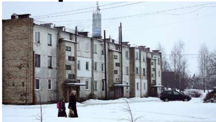
No 6.jūnija Siguldas novadam tiks pievienots Allažu pagasts.

Mores pagastam atvēlēto līdzekļu apjoms kopš apvienošanās 2003.gada jūnijā ir ievērojami pieaudzis. "Uzskatu, ka pievienošanās Siguldas novadam bija vienīgā izeja, lai Mores pagasts spētu nodrošināt iedzīvotājiem tos pakalpojumus, kurus nosaka Latvijas normatīvie akti, jo ar pagastam pieejamo budžetu tos mēs nevarējām nodrošināt. Lielākais ieguvējs no apvienošanās ir Mores pamatskola – tas, ka pagastā joprojām ir skola, ir Siguldas novada nopelns, jo, pateicoties Attīstības pārvaldes piesaistītajam finansējumam, tika piesaistīts ESF finansējums un izveidota apmācību programma bērniem ar īpašām vajadzībām, kā arī uzlabota skolas materiāli tehniskā bāze. Mores pamatskolas rīcībā ir divi jauni autobusi, lai nodrošinātu bērnu nokļūšanu skolā. Pēc apvienošanās ar Siguldas novadu, kapitālais remonts ir veikts ne tikai Mores pamatskolā, bet arī kultūras namā un pagasta namā. Trijām pašvaldības ēkām ir nomainīti jumti. Aizvadītajā laikā ir ievērojami pieaugši Sociālās palīdzības iespējas un apjoms iedzīvotājiem. Pateicoties novada un valsts finansējumam, tiek sakārtota arī pagasta infrastruktūra – 2007.gadā tika uzsākts autoceļa Jūdaži – Nitaure kapitālais remonts, plānots, ka darbi tiks turpināti arī 2009.gadā. Regulāri uzturēti un kopti tiek arī paš-