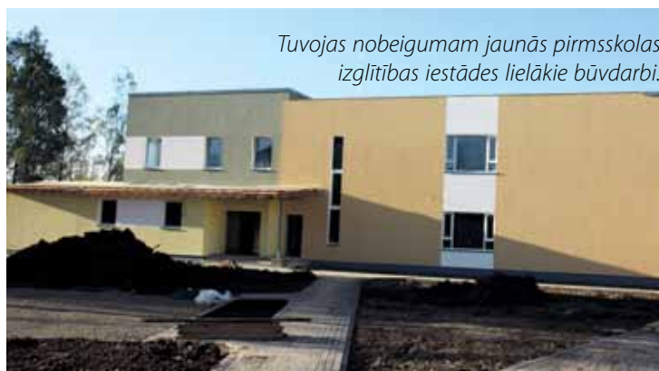
Tuvojas nobeigumam jaunās pirmsskolas izglītības iestādes lielākie būvdarbi.

Lai attīstītu Siguldas novada sporta bāzes, šogad nomainīts skrejceļiņa un futbola laukuma segums stadionā pie 2. vidusskolas, iztērējot 38 tūkstošus latu.