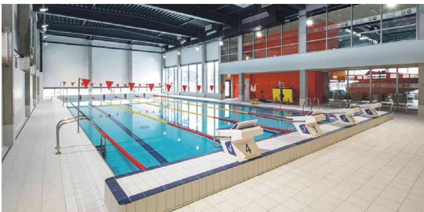
Siguldas Sporta centrā pieejama multifunkcionāla sporta zāle, 25 metrus garš peldbaseins, bērnu peldētamācības baseins, treniņzāle un fitnesa zāles, kā arī ūdens atrakciju un atpūtas zona ar dažādām pirtīm

Pasākuma ietvaros plkst.12.00 svinīgi tiks atklāts Siguldas Sporta centrs, tālāk aicinot novadniekus pilsētas stadiona zonā kopā svinēt Latvijas dzimšanas dienu, uzaust Latvijas karogu, kā arī dāvināt savus nākotnes vēlējumus gan Siguldas novadam, gan Latvijai.