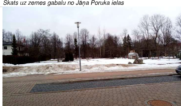
Skats uz zemes gabalu no Jāņa Poruka ielas