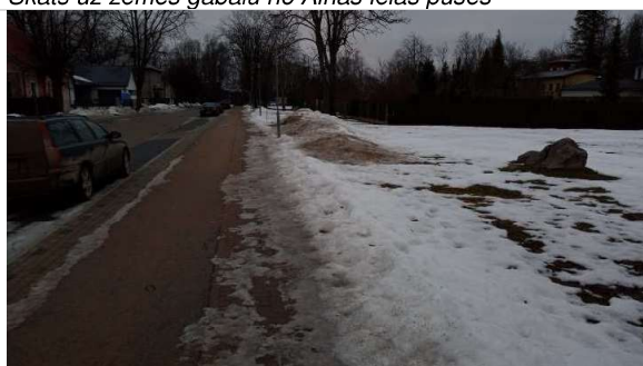
Piebraucamais ceļš – Jāņa Poruka iela