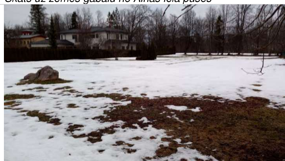
Skats uz zemes gabalu no Jāņa Poruka ielas puses