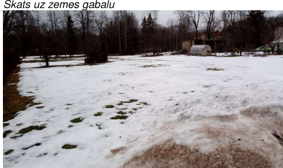
Skats uz zemes gabalu Jāņa Poruka ielas puses