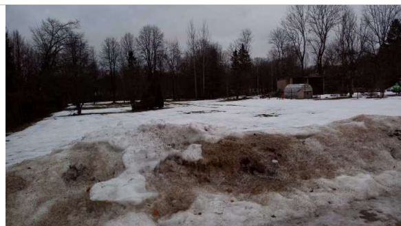
Skats uz zemes gabalu no Jāņa Poruka ielas