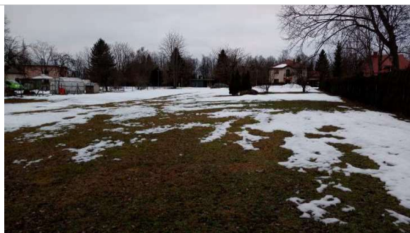
Skats uz zemes gabalu