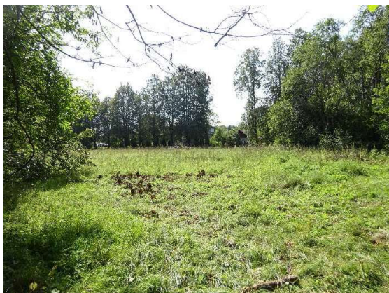
Skats uz zemes gabalu