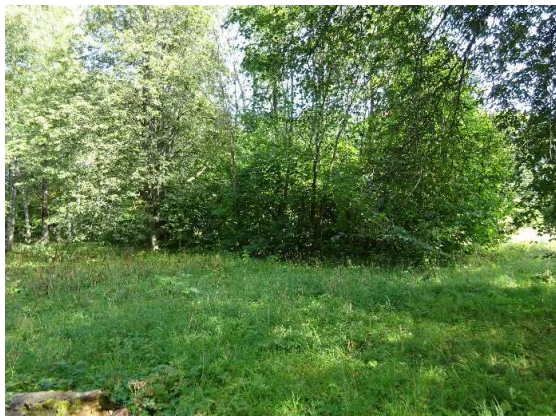
Skats uz zemes gabalu