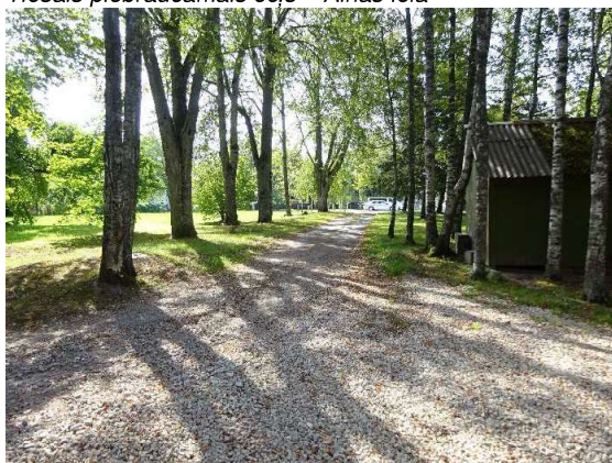
Tiešais piebraucamais ceļš – Ainas iela