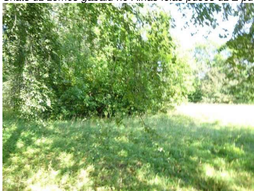
Skats uz zemes gabalu