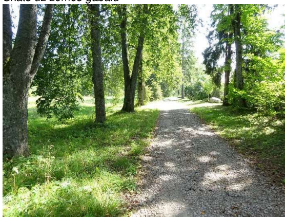
Tiešais piebraucamais ceļš – Ainas iela