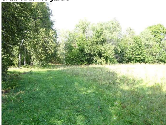
Skats uz zemes gabalu no Ainas ielas puses uz Z pusi