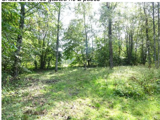
Skats uz zemes gabala Z pusi