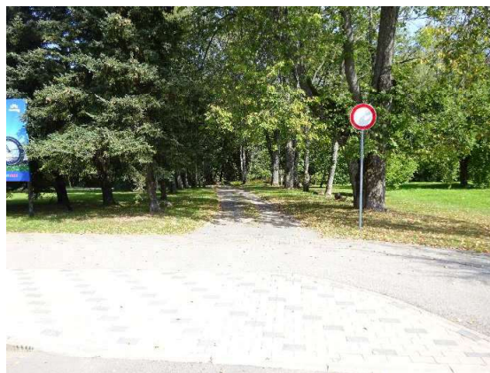
Piebraucamais ceļš no stāvlaukuma puses