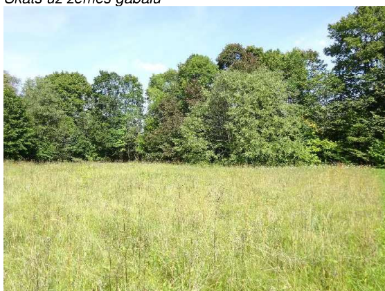
Skats uz zemes gabalu