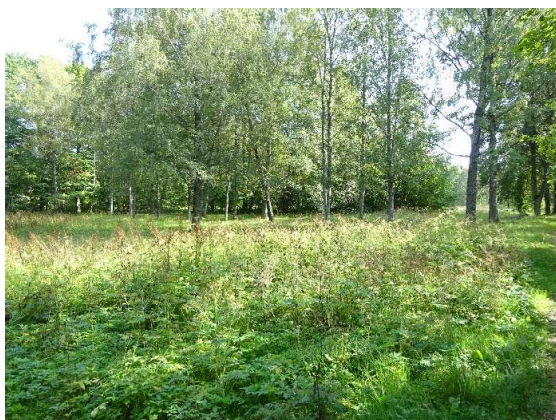
Skats uz zemes gabalu no Ainas ielas