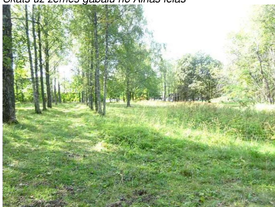
Skats uz zemes gabalu no Z puses