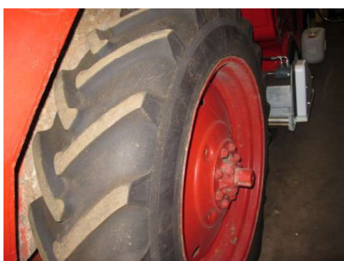
Riepa pakalējā, kreisā puse