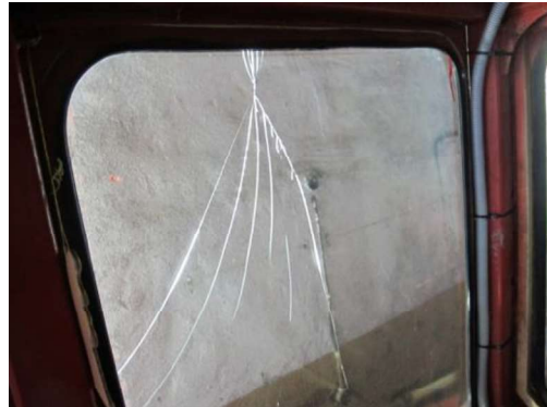
Saplēsts sānu stikls