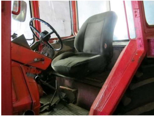
Salons ar sēdvietu