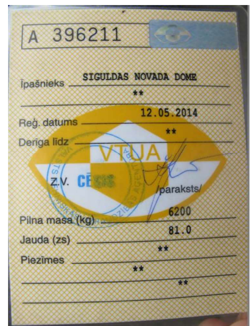
Reģistrācijas apliecība - 2