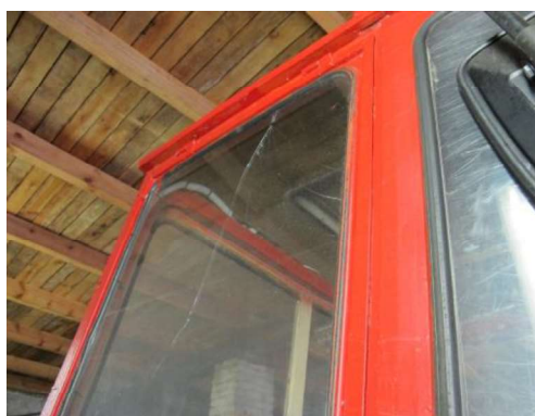
Saplēsts sānu stikls