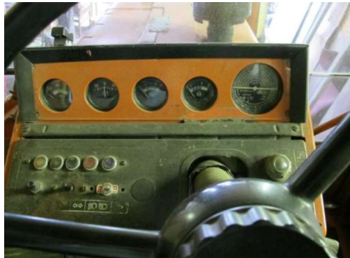
Vadības panelis ar stūres ratu