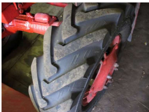
Priekšējā riepa, kreisā puse