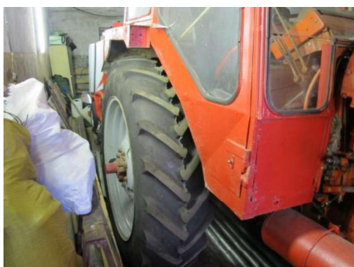
Riepa pakalējā - labās puses