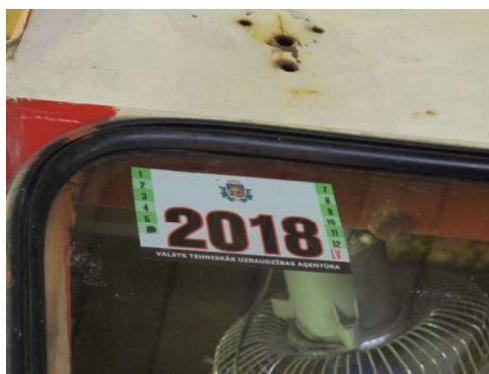
Tehniskās apskates uzlīme