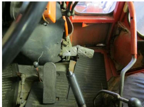
Grīda ar vadības svirām