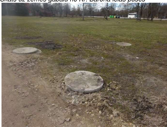
Siltumtrases pieslēguma vieta