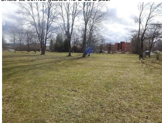
Skats uz zemes gabalu no Z uz D pusi