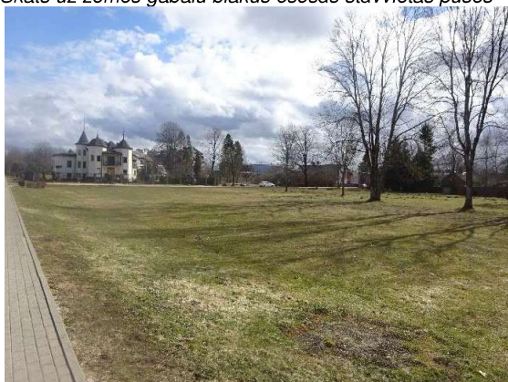
Skats uz zemes gabalu no Kr. Barona ielas puses