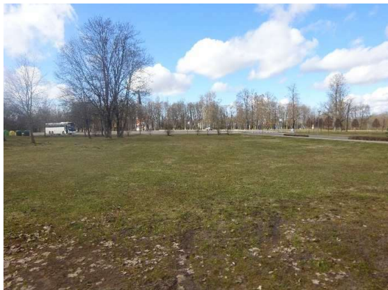
Skats uz zemes gabalu no Kr. Barona ielas puses