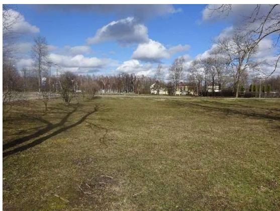
Skats uz zemes gabalu blakus esošās stāvvietas puses