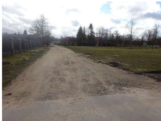
Piebraucamais ceļš – Eduarda Veidenbauma iela