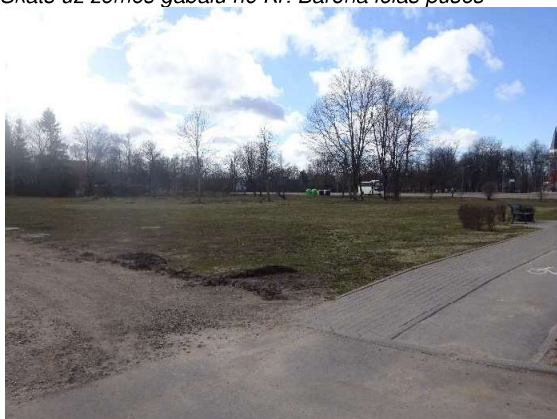
Skats uz zemes gabalu no Kr. Barona un Eduarda Veidenbauma ielas krustojuma puses