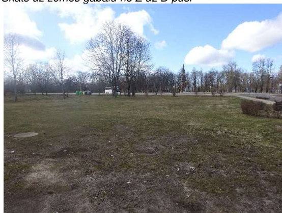
Skats uz zemes gabalu no Kr. Barona ielas puses