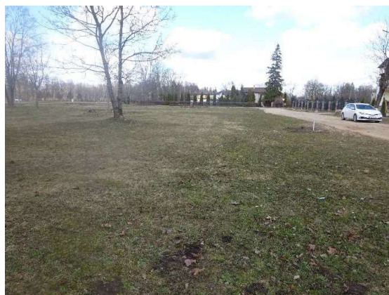
Skats uz zemes gabalu no D uz Z pusi gar ielu