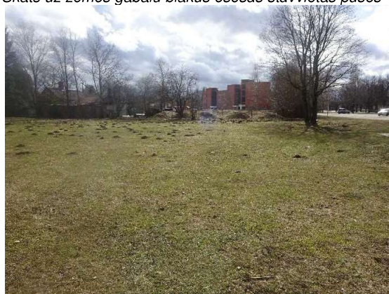
Skats uz zemes gabalu no Z uz D pusi