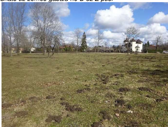
Skats uz zemes gabalu blakus esošās stāvvietas puses