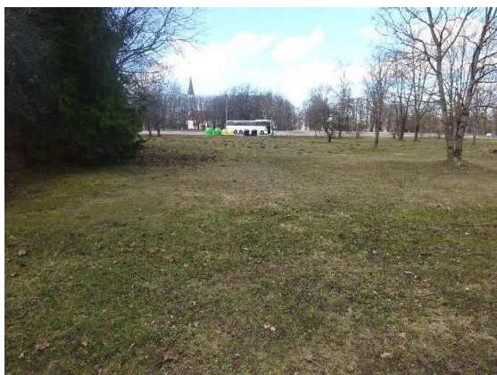
Skats uz zemes gabalu no Eduarda Veidenbauma ielas