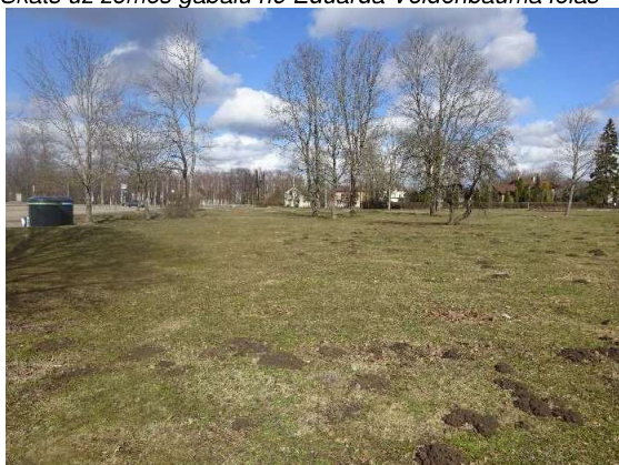
Skats uz zemes gabalu no D uz Z pusi