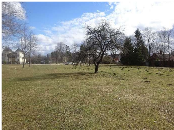
Skats uz zemes gabalu no stāvvietas puses