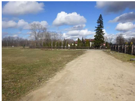
Piebraucamais ceļš – Eduarda Veidenbauma iela