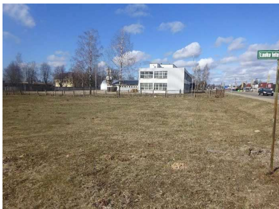
Skats uz zemes gabalu no Lauku ielas puses