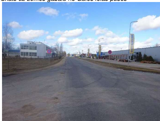
Piebraucamais ceļš – Gāles iela