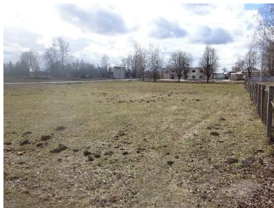
Skats uz zemes gabalu no Gāles ielas puses