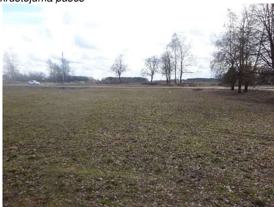
Skats uz zemes gabalu no Z uz D pusi