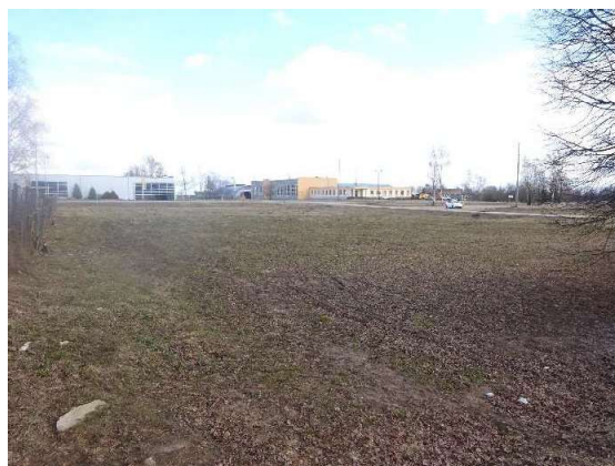
Skats uz zemes gabalu no Mālpils ielas puses