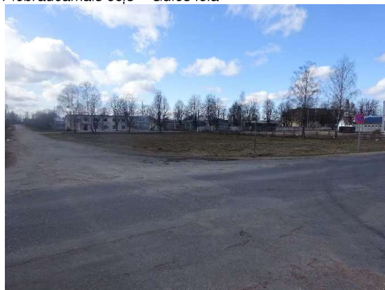
Skats uz zemes gabalu no Gāles un Lauku ielas krustojuma puses