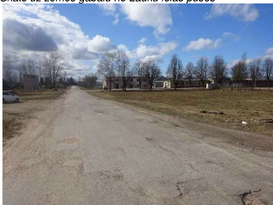
Piebraucamais ceļš – Lauku iela