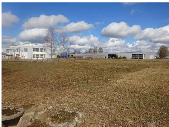
Skats uz zemes gabalu no Mālpils un Lauku ielu krustojuma puses