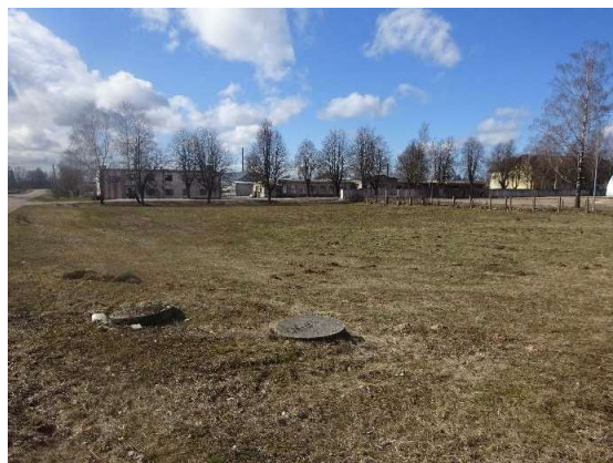
Skats uz zemes gabalu no Gāles ielas puses