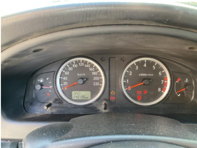
Attēls Nr. 13