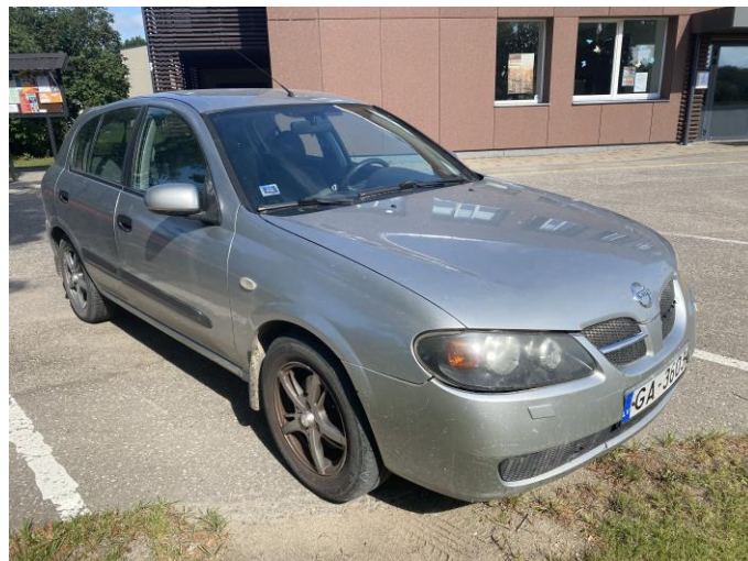
Attēls Nr. 2