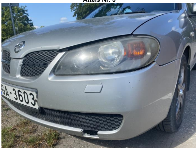
Attēls Nr. 5