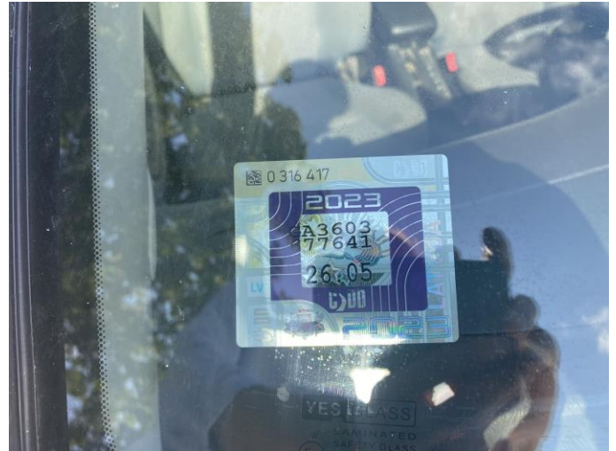
Attēls Nr. 14