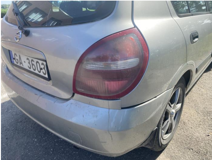
Attēls Nr. 7