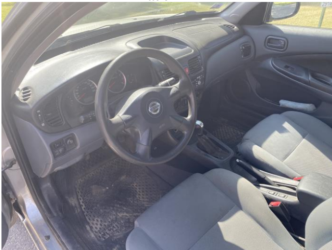
Attēls Nr. 9