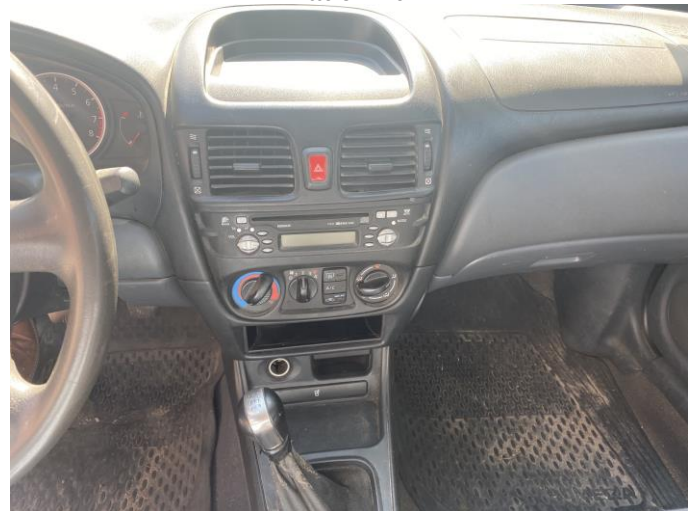
Attēls Nr. 10