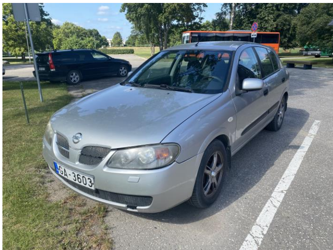
Attēls Nr. 1