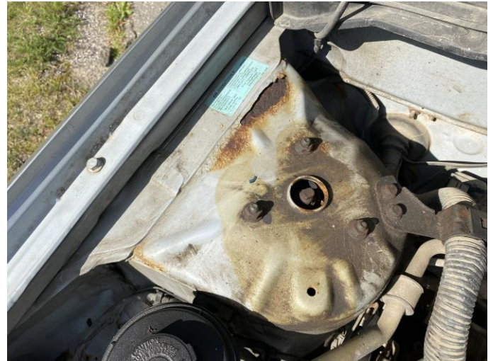
Attēls Nr. 8