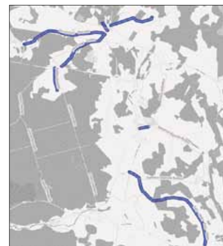
Šajos grantēto ielu un ceļu posmos Allažos notiks brauktuves seguma atjaunošana

Drīzumā noslēgsies iepirkumu procedūras asfaltēto ielu un ceļu būvdarbiem Siguldas pilsētā un pagastā. Šovasar plānota valsts autoceļa A2 krustojuma pārbūve no Saules ielas līdz Ventas ielai, kā arī gājēju ietves izbūve no Ventas ielas līdz Saltavota ielai Siguldā. Tāpat norisināsies cietā seguma izbūve Meldru un Doņu ielā, kā arī Miera ielas pārbūve. Ielu segums tiks atjaunots Pulkveža Brieža ielā no valsts autoceļa A2 līdz apļveida krustojumam pie Siguldas 1.pamatskolas, kā