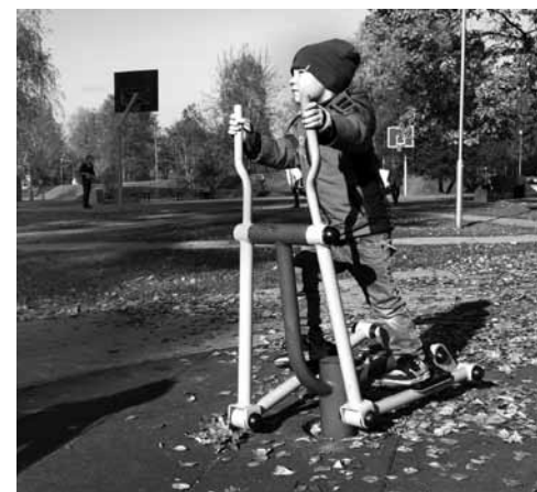
Mazie novadnieki atzinīgi novērtē jaunos treniņus

Siguldā novada pašvaldības speciālisti aicina pret bērnu rotaļu elementiem izturēties ar rūpību – katru gadu rotaļu laukumos tiek veikti postījumi, kas pašvaldībai izmaksā vairākus tūkstošus eiro, liedzot veikt lielākas investīcijas rotaļu laukumu pilnveidošanā. Gadījumos, kad iekārtas tiek bojātas vai neatbilstoši lietotas, pašvaldības speciālisti lūdz vecākus nebūt vienaldzīgiem un aizrādīt līdzcīvēkiem vai nepieciešamības gadījumā informēt Siguldā novada Pašvaldības policiju.